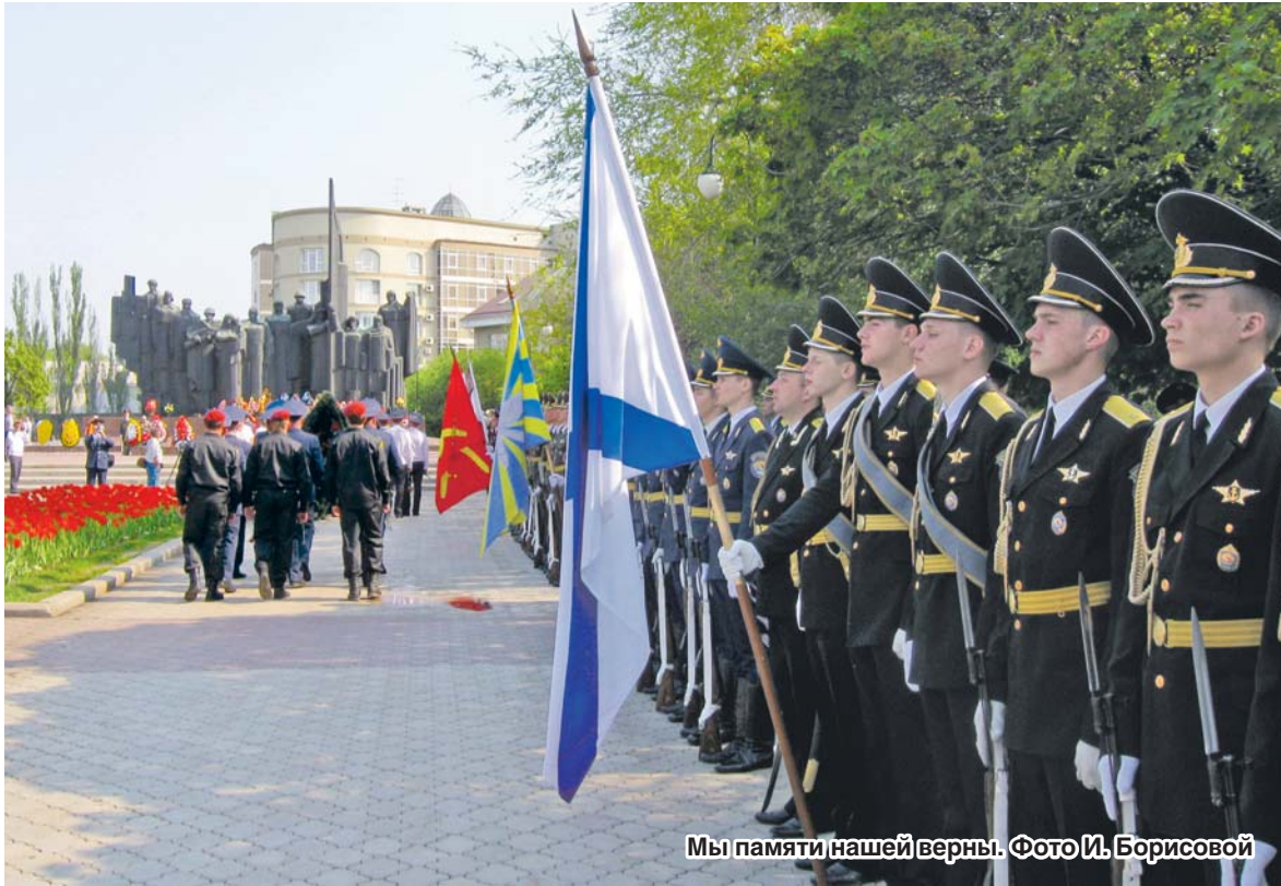
Мы памяти нашей верны.

пило огромное количество обращений. Каждое требовало внимательного и чуткого подхода.