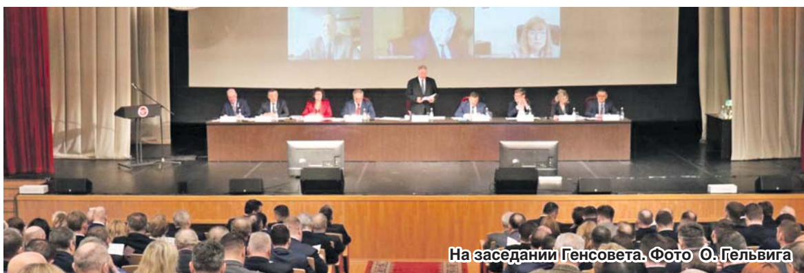
На заседании Генсовета.

Заключительный этап фестиваля запланирован на День профсоюзов Воронежской области – 17 октября 2023 года в виде гала-концерта, в котором выступят творческие коллективы и отдельные исполнители – победители отборочных туров.