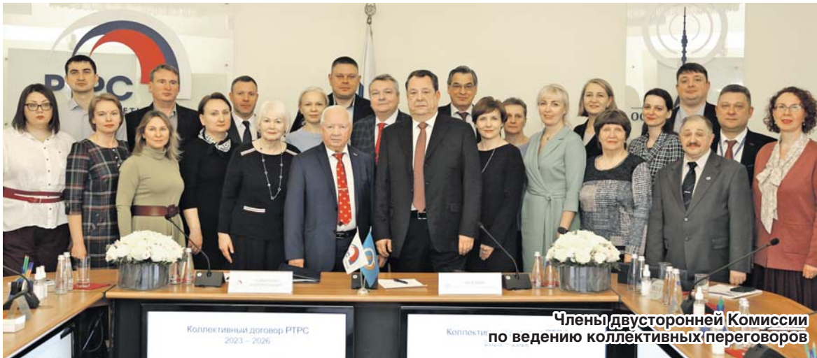
Члены двусторонней Комиссии по ведению коллективных переговоров

Областной комитет Профсоюза принял решения: продолжать осуществлять постоянный контроль за выполнением норм отраслевых федеральных соглашений, коллективных договоров на предприятиях и в организациях; проводить мониторинг применения норм и гарантий, установленных отраслевыми соглашениями и коллективными договорами; принимать меры по стабилизации ситуации в автотранспортных предприятиях, взаимодействуя с органами власти и др.