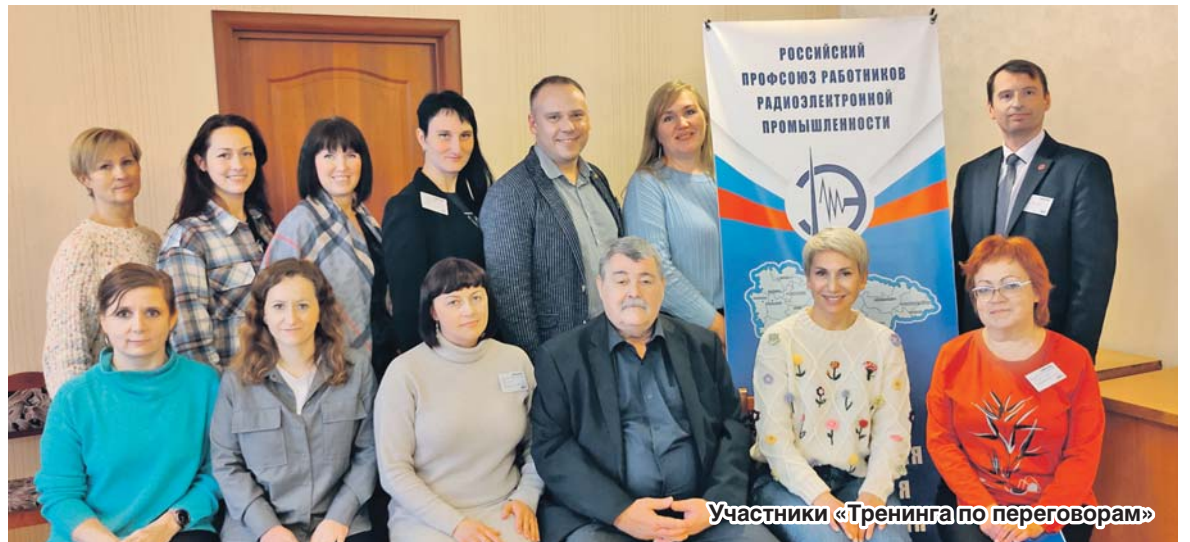
Участники «Тренинга по переговорам»

Безусловно, итогом проведенного тренинга будет являться то, что каждый участник, четко осознавая свои сильные и слабые стороны и используя полученные на занятиях знания, впредь будет качественно проводить любые переговоры!