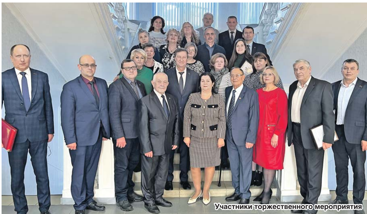
Участники торжественного мероприятия

Стороны обменялись информацией о молодежных мероприятиях, запланированных на текущий год, и договорились оказывать друг другу содействие в организации их проведения. Также решено проработать вопрос о заключении соглашения о взаимодействии Профобъединения и управления молодежной политики Правительства Воронежской области.