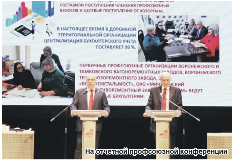
На отчетной профсоюзной конференции

По итогам голосования делегаты конференции признали работу комитета первичной профсоюзной организации РОСПРОФЖЕЛ на ЮВЖД и комитета Дорпрофжел на ЮВЖД за отчетный период удовлетворительной.