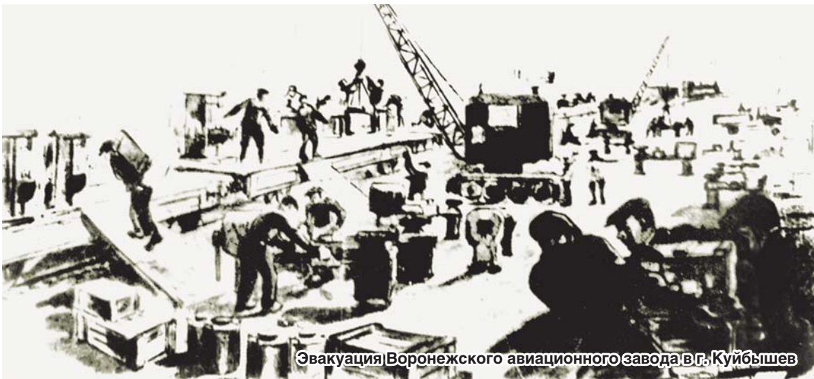
Эвакуация Воронежского авиационного завода в г. Куйбышев

организаций в соответствии с требованиями военного времени и фактически возглавили трудовой героизм рабочих и служащих по обеспечению нужд фронта. Первостепенная задача – перевод народного хозяйства на военные рельсы. Только одним приказом и начальственным окриком провести ее невозможно. Нужно было вовлечь в процесс ручного управления массу людей, достигая до души каждого, сделать конкретного человека активным соучастником событий. Поэтому цех, профсоюзная группа, конкретный человек превратились в центр профсоюзной работы. Собрания, совещания, беседы стали проводиться большей частью на рабочих местах по бригадам и профгруппам. Огромную роль в мобилизации рабочих и служащих сыграли производственные совещания, за проведение которых отвечали фабрично-заводские комитеты. На коллективное мнение выносились актуальные вопросы освоения