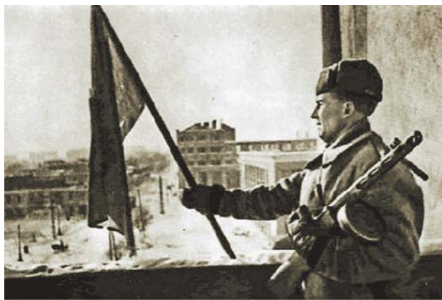
25 января 1943 года на балконе гостиницы «Воронеж» (ныне здание Воронежского облсовпрофа) – Красное знамя освобождения города