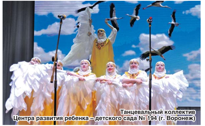
Танцевальный коллектив Центра развития ребенка – детского сада № 194 (г. Воронеж)