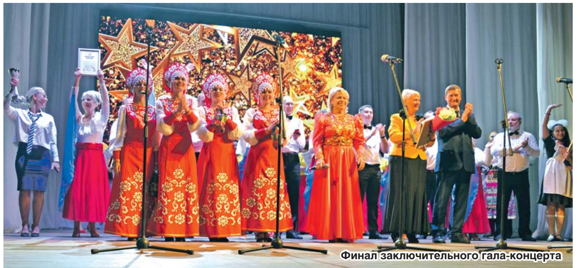
Финал заключительного гала-концерта