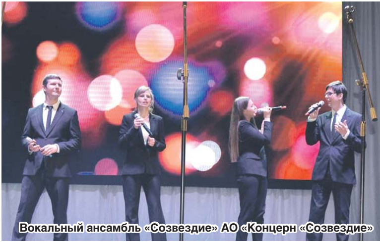
Вокальный ансамбль «Созвездие» АО «Концерн «Созвездие»