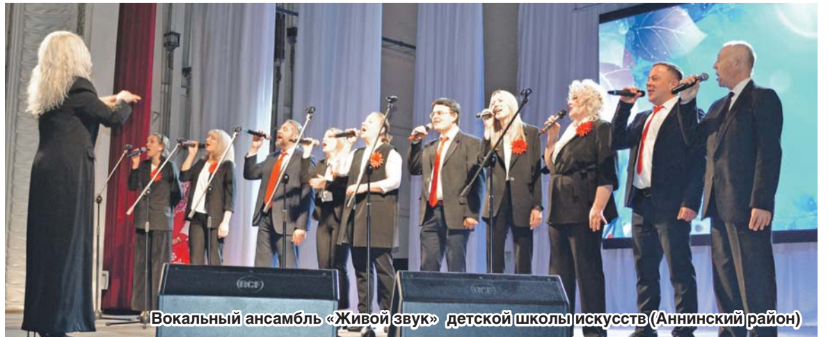
Вокальный ансамбль «Живой звук» детской школы искусств (Аннинский район)