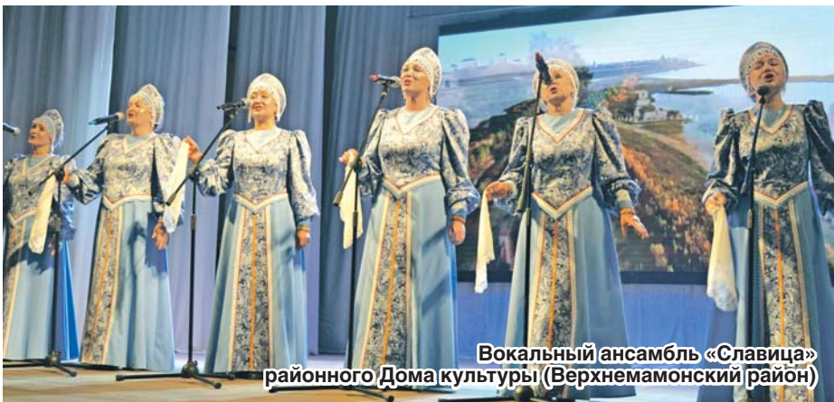
Вокальный ансамбль «Славица» районного Дома культуры (Верхнемамонский район)