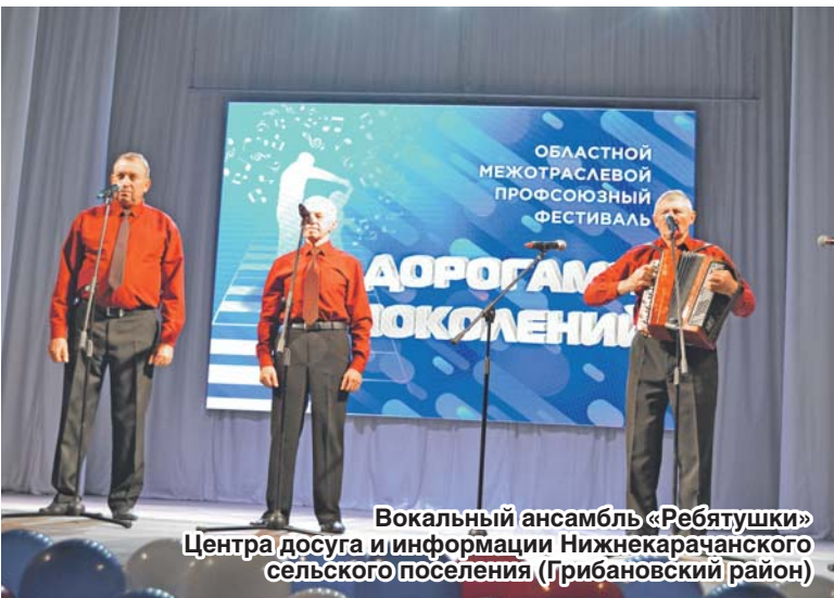
Вокальный ансамбль «Ребятунки» Центра досуга и информации Нижнекарачанского сельского поселения (Грибановский район)