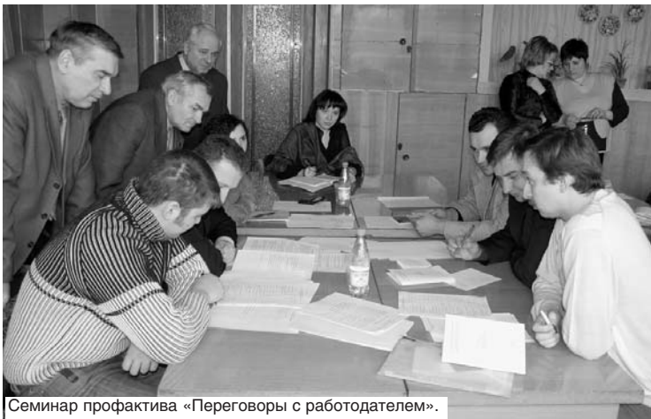
Семинар профактива «Переговоры с работодателем».

С ПРОФСОЮЗОМ ТЫ НЕ БУДЕШЬ ОДИН! ВМЕСТЕ МЫ ЗАЩИТИМ СВОИ ПРАВА!