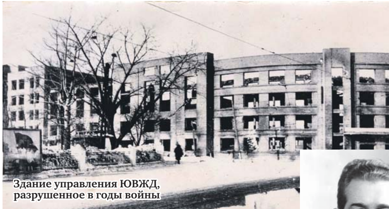
Здание управления ЮВЖД, разрушенное в годы войны

Откликаясь на этот патристический порыв, Сталин перал юго-восточникам свой братский привет и благодарность Красной армии.