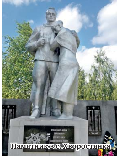
Памятник в с. Хворостянка

В нашу семью пришло большое горе. Но надо было как-то жить дальше. Мама работала в колхозе: косила, сеяла, водила плуг, таскала