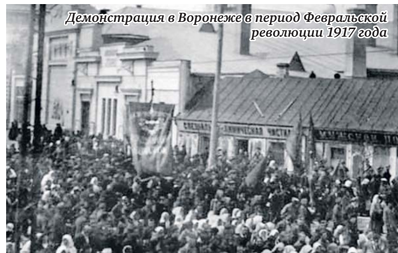
Демонстрация в Воронеже в период Февральской революции 1917 года

Из книги «Воронежские профсоюзы: взгляд сквозь годы»